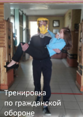
Тренировка по гражданской обороне