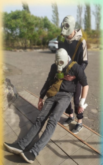
Тренировка по гражданской обороне

Каждый из вас должен помнить о своей безопасности , и уметь уберечь себя и близких от беды в любой жизненной ситуации.