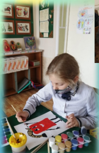
Конкурс рисунков «Помни о своей безопасности!»