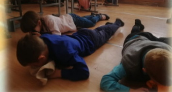
На уроке русского языка о гражданской обороне